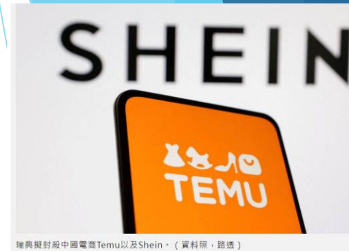
瑞典擬封殺中國電商Temu以及Shein。